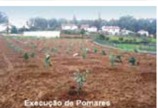
Execução de Pomares