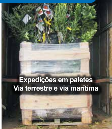
Expedições em paletes Via terrestre e via marítima