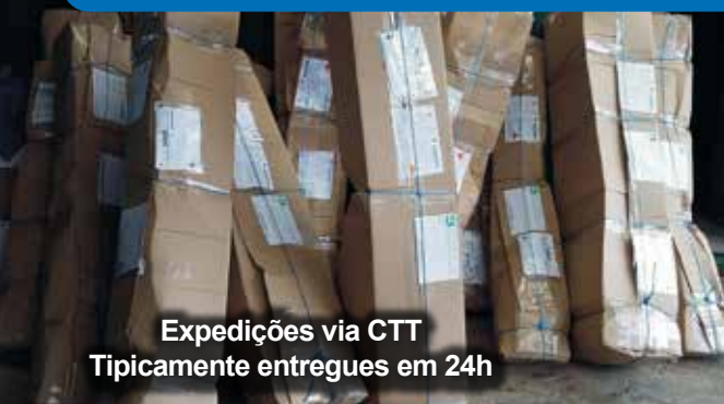
Expedições via CTT Tipicamente entregues em 24h