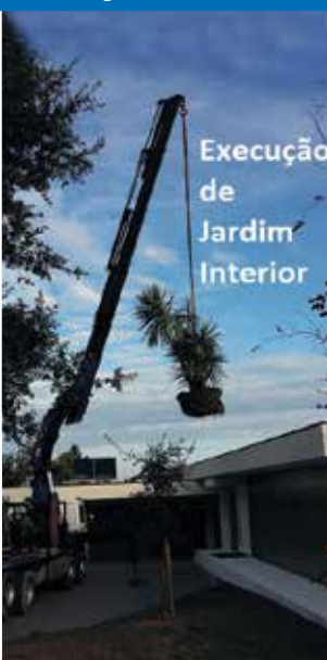
Execução de Jardim Interior