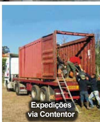
Expedições via Contentor