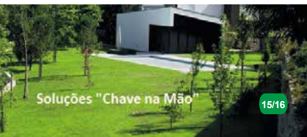
Soluções "Chave na Mão"