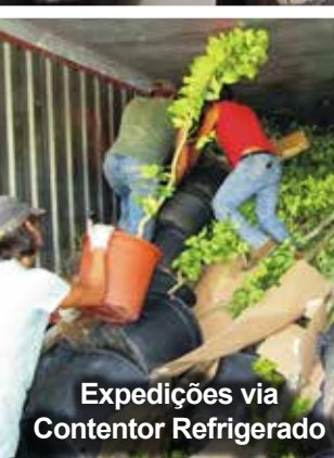
Expedições via Contentor Refrigerado