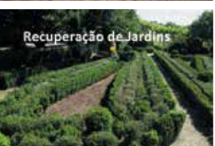
Recuperação de Jardins