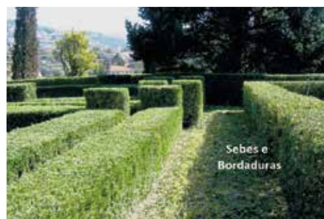
Sebes e Bordaduras