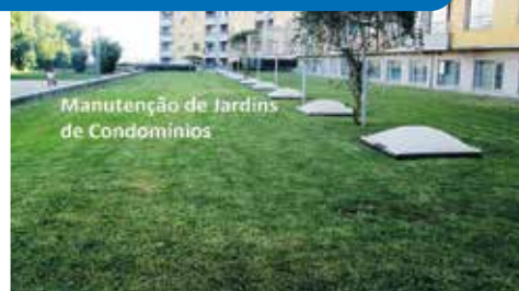
Manutenção de Jardins de Condomínios