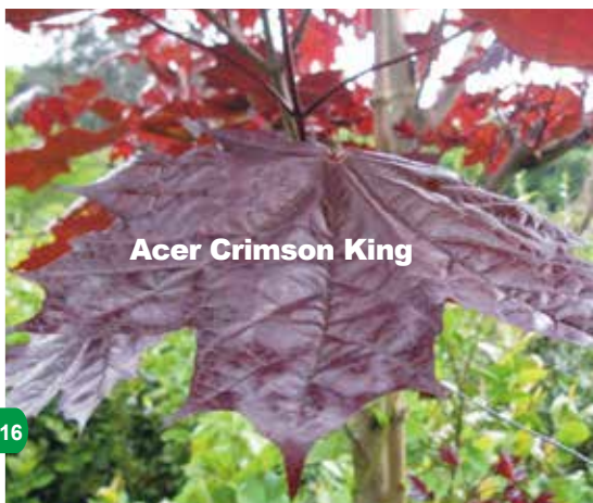
Acer Crimson King