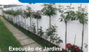
Execução de Jardins