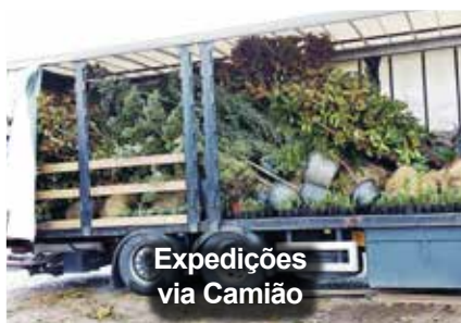
Expedições via Camião